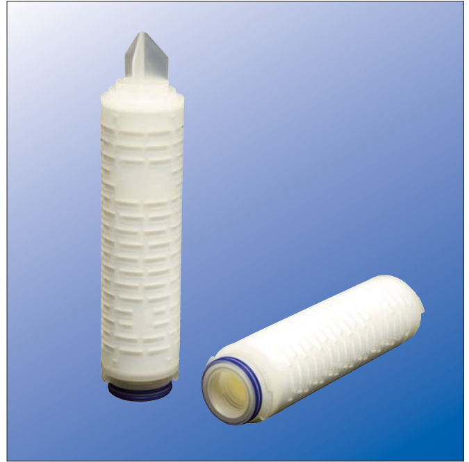
Elemento filtrante MEMBRACart XL II

Onde assicurare la tracciabilità, ogni elemento filtrante è marchiato sulla gabbia con codice di ordinazione e numero di lotto. Inoltre, ogni cartuccia filtrante riporta un numero individuale. Nome del prodotto, potere di rimozione, codice di ordinazione e numero di lotto sono indicati sull'etichetta.